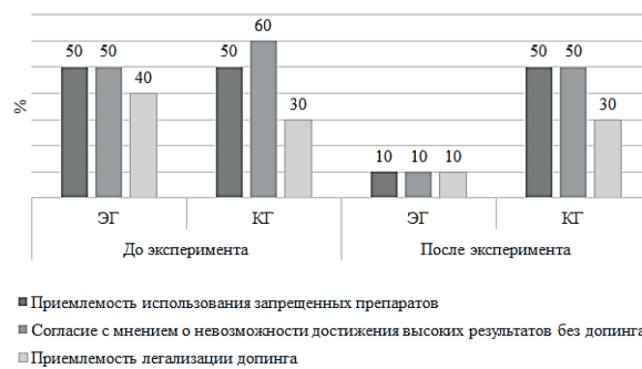
Рис. 2. Динамика отношения к допингу спортсменов-регбистов в педагогическом эксперименте