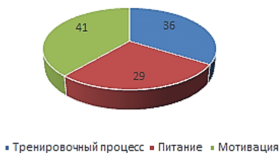
Рис. 2. Процентное соотношение желаемых и полученных респондентов