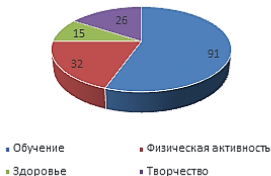
Рис. 1. Соотношение всех запросов к ИИ по группам

Проведенное исследование представляло собой первый этап комплексного подхода, направленного на изучение использования нейросетей в системе высшего образования, а также в повседневной жизни студентов и преподавателей. Оно позволило собрать первичные данные респондентов относительно их установок, связанных с использованием