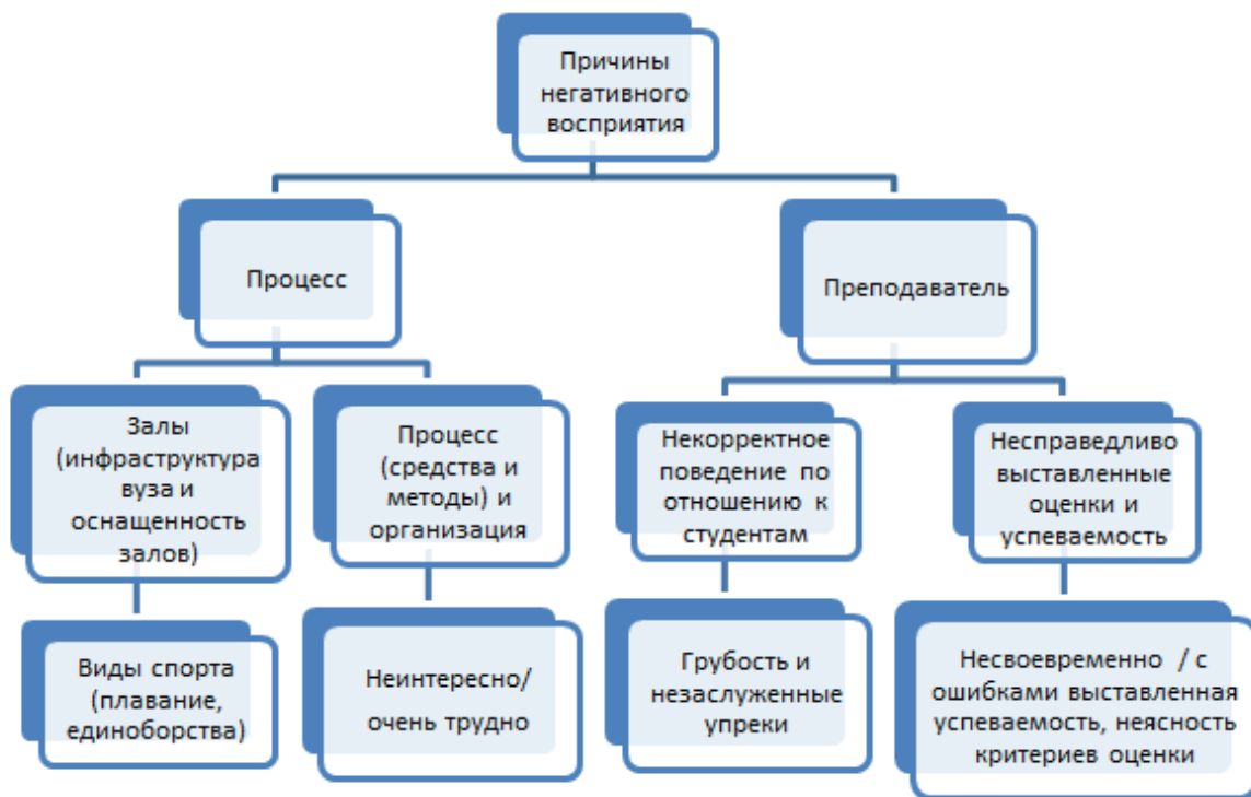
Рис. 1. Причины негативного восприятия студентами дисциплины «Физическая культура»

Вторая группа причин, наносящих урон престижу и значимости кафедры, относится к персоне самого преподавателя. Большое количество студентов отмечали проявление оппортунизма, которое выразалось в некорректном поведении