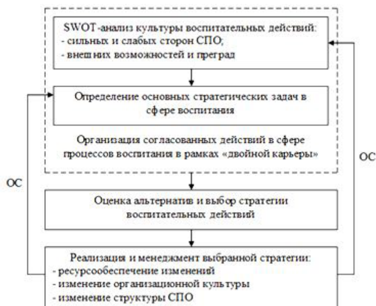
Рис. 2. Схема стратегического процесса воспитательных действий: ОС — обратная связь, определяющая аналитическую деятельность в сфере воспитания

Говоря о формировании, развитии и саморазвитии личности в самом широком плане, необходимо затронуть вопросы ее структуры, условий и механизмов, обеспечивающих эти процессы. По сути, любой индивид после рождения по мере социализации приобщается к тому содержанию человеческой деятельности, закрепленному в общественном сознании, которое и определяет его индивидуальное сознание. В нашей работе исследованию подлежит «спортивная личность», определяемая рядом характеристик. Это: внутренняя сила свободы, центрирующая сила культуры, сверхличностные устремления, сверхиндивидуализм. Последний, в нашем представлении, прежде всего связан с патриотизмом (глубоким — в рамках внутреннего «я» — и менее глубоким).